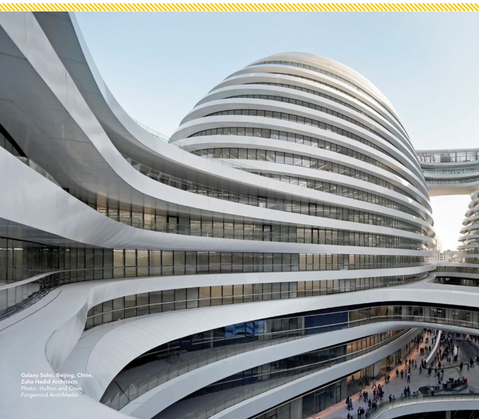
Galaxy Soho, Beijing, Chine, Zaha Hadid Architects

Manque-t-il de femmes en architecture? La question peut sembler saugrenue en 2014. Pourtant, les inégalités n'ont pas encore entièrement disparu. Coup d'œil sur un phénomène désuet. • Par Gabrielle Ancil